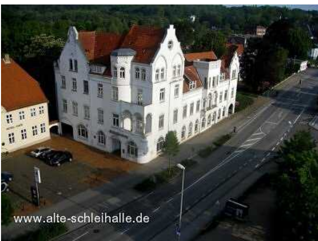
Das leerstehende Gebäude im Mai 2009.

Nachdem ein Investor mit seinen Plänen scheiterte, auf dem Grundstück ein Pflegeheim zu errichten, erwarb der Architekt Volker Stoll das Anwesen. Das Gebäude steht seit 2003 leer und ist dem Verfall ausgesetzt. Ein Abbruch des alten Hotelkomplexes ist seit 2003 geplant.