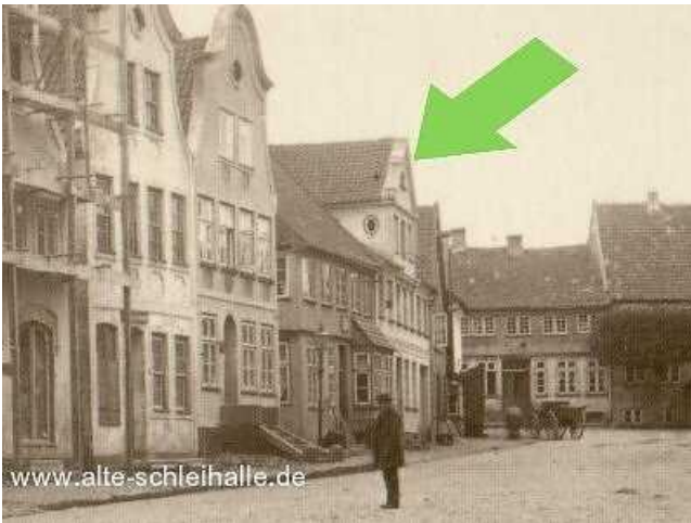
Gallber 15. Ausschnitt einer Aufnahme von 1864.