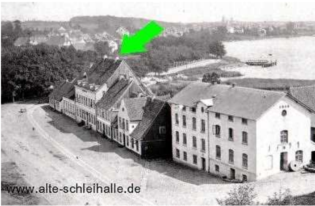
Der Gasthof um 1864. Links vom Gebäude das noch einstöckige Nebengebäude.