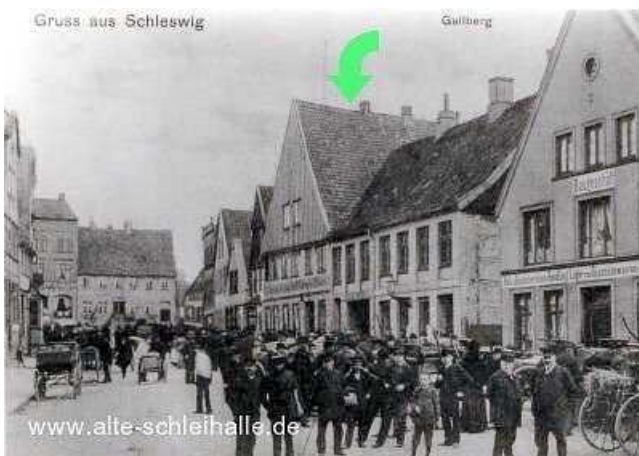
Das "Landwirtschaftliche Haus", ehem. "Zum Prinzen".

In den 70er Jahren des 20.Jhd. wurde dieses Gebäude sowie die Nachbarhäuser abgebrochen und durch einen damals modernen Betonklotz (heute u.a. Verbrauchermarkt "SKY") ersetzt.