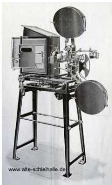
Ein kinematographischer Projektor von 1911. Typ Ernemann Stahl Projektor Imperator - stärkstes kettenloses Modell !

Der Gastwirt plante am Totensonntag 1916 eine Lichtspielvorführung zu geben, dessen Einnahmen-Überschuß an die Schleswiger Kriegshilfe weitergegeben worden wäre. Die Polizeiverwaltung verbot diese Aufführung mit dem Hinweis, das nach der "Polizeiverordnung des Herrn Oberpräsidenten vom 23.10.d.Js. öffentliche Lustbarkeiten der bezeichneten Art am Totensonntage nicht stattfinden dürfen."