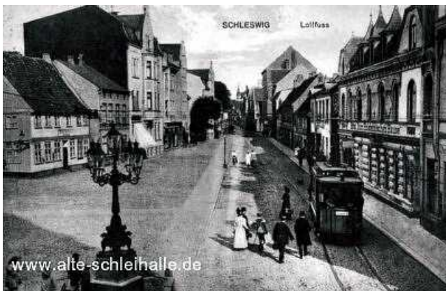
Das "Holsteinische Haus" mit der Straßenbahn im Vordergrund.