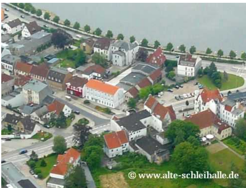
Die Größe des Gebäudes ist erst aus der Luft erkennbar.

Im Juli 2011 wird das dänische Sekretariat das ehemalige Hotelgebäude beziehen. Sobald die Sanierungsarbeiten es erlauben, werden auch die dänische Bibliothek sowie das Büro der Flensburg