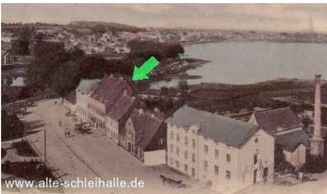
Der Gasthof nach der Aufstockung des Nebengebäudes 1894.