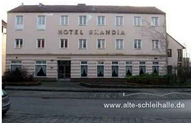
Das " Hotel Skandia " im Januar 2008.

Die dänische Minderheit richtete in dem "Slesvighus" u.a. eine Bibliothek, einen Kirchensaal, einen Kindergarten und einen Jugendverein ein. Der letzte große Umbau erfolgte 1955, das Gebäude wurde um eine Etage aufgestockt. Zeitgleich erhielt das Haus der dänischen Minderheit erneut einen anderen, den mittlerweile dritten Namen - es wurde das " Hotel Skandia ".