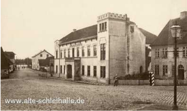
Hotel Stadt Hamburg. Ikonographie 1864.