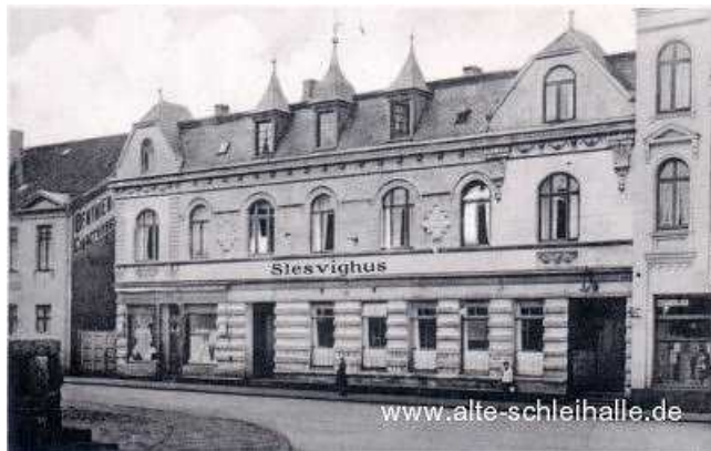
1923 erfolgte die Umbenennung in " Slesvighus ". Die beiden Erker wurden bereits 1904 umgebaut.

Allerdings waren nicht alle Einwohner mit dieser Umbenennung einverstanden. So kam es während der Einweihung des Schleswiger Bahnhofs zu einer Prügelei zwischen dänischen Gästen aus Flensburg und deutschen Schleswigern.