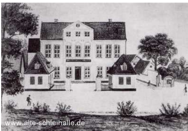
Das alte Patrizierhaus, Darstellung um 1860.