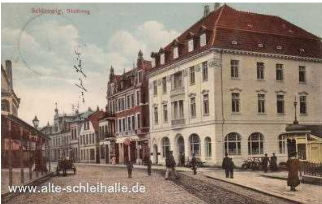
Der Neubau von 1908.

Während der dänischen Vorherrschaft in Schleswig hatte die Gastwirtsfamilie Ravens mit wirtschaftlichen Einbußen zu kämpfen, da die Familie Ravens immer treu zur deutschen Sache standen. Erst nach Beendigung der dänischen "Bedrückungszeit" blühte das Geschäft wieder auf, so fand z.B. am 27.Februar 1864 der "Ball der Österreicher" im Gasthaus statt, ferner die Begrüßung der Lichtensteiner Husaren nach ihrer Rückkehr aus dem Norden am 22.November 1864 sowie das Abschiedessen der Schleswiger Bürgerschaft zu Ehren des Generals von Manteuffel am 23.September 1866.