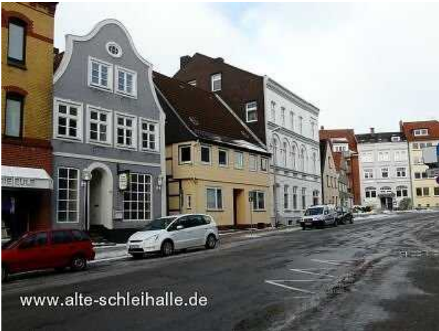
Gallber 15 im Januar 2010. Das heutige Gebäude muß in der Zeit zwischen 1864 und 1882 errichtet worden sein.

Das Grundstück reichte im rückwärtigen Bereich bis an den Kattsund heran, auf dem hinteren Grundstück befanden sich Stallungen, die Waschküche und ein Eishaus, welches 1920 zu einem Pferde- und Kuhstall umgebaut wurde. Der Hof konnte mittels einer Durchfahrt vom Gallberg erreicht werden. Diese Durchfahrt befand sich dort, wo heute rechts im Erdgeschoß ein großes Fenster eingebaut ist. Für den Einbau eines Clubraumes wurde 1964 die Durchfahrt vermauert.