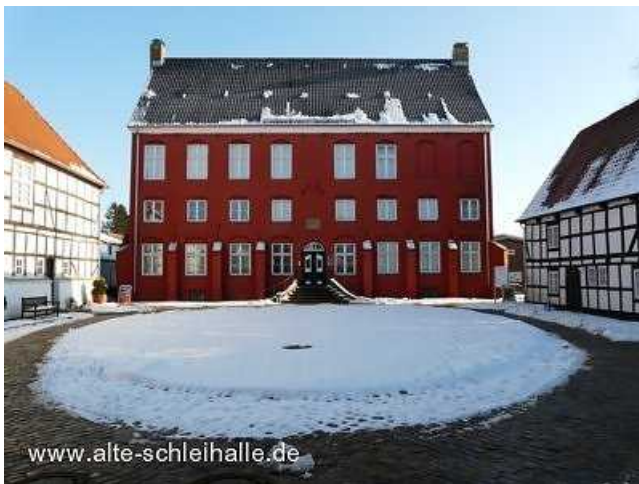
Das ehem. Gästepalais, heute Stadtmuseum.