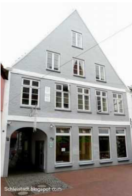
Der ehemalige "Königshof" im September 2009.