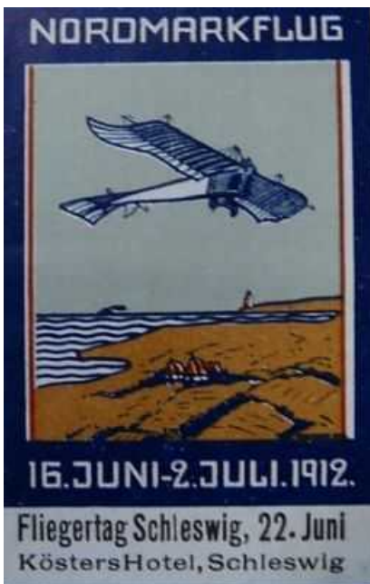
Zum Fliegetag am 22. Juni 1912 im Rahmen des Nordmarkfluges wurde in Kösters Hotel gefeiert.