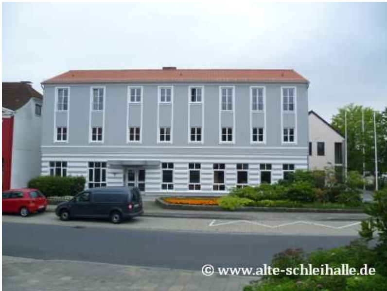
Das "Slesvighus" im Juli 2011

Mittlerweile hat die dänische Minderheit ihre Absicht bekannt gegeben, das Gebäude wieder selbst nutzen zu wollen. Zunächst solle das dänische Sekretariat in das leerstehende Gebäude einziehen, zusätzlich sollen einige Gruppenräume hergerichtet werden. Eine notwendige Totalsanierung des Gebäudes wird mit etwa 2 Millionen Euro angegeben, diese wird aus Kostengründen jedoch nur stückweise erfolgen.