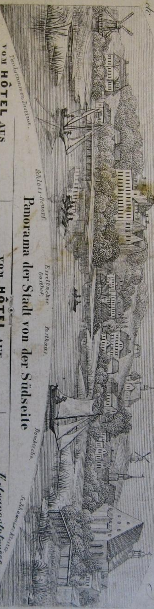
Panorama der Stadt von der Südseite